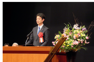
来賓あいさつ 熊谷千葉県知事